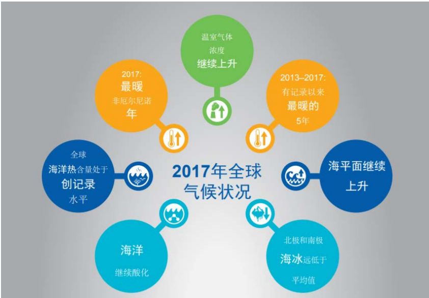
图 2- 《WMO 气候状况声明》（2017）中采用的气候系统的重要指标