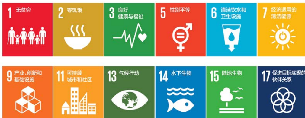
图 1 – WMO 对 SDG 的贡献