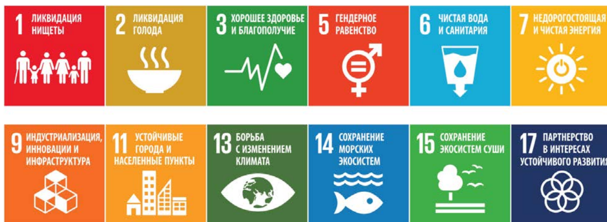
Рис. 1. Вклад ВМО в осуществление ЦУР

В настоящем кратком аналитическом обзоре описывается, как национальная и глобальная деятельность под эгидой ВМО помогает найти ответы на вопросы, поставленные в рамках Диалога Таланоа, посредством информации и знаний о метеорологии, гидрологии, климате и окружающей среде. Также предлагаются пути использования такой информации в процессах выработки и осуществления политики.