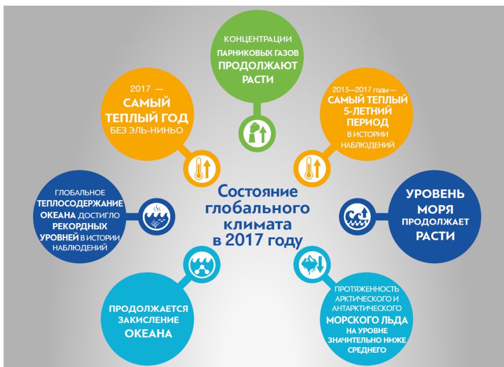
Рисунок 2. Главные показатели климатической системы, использованные в Заявлении ВМО (2017 год)