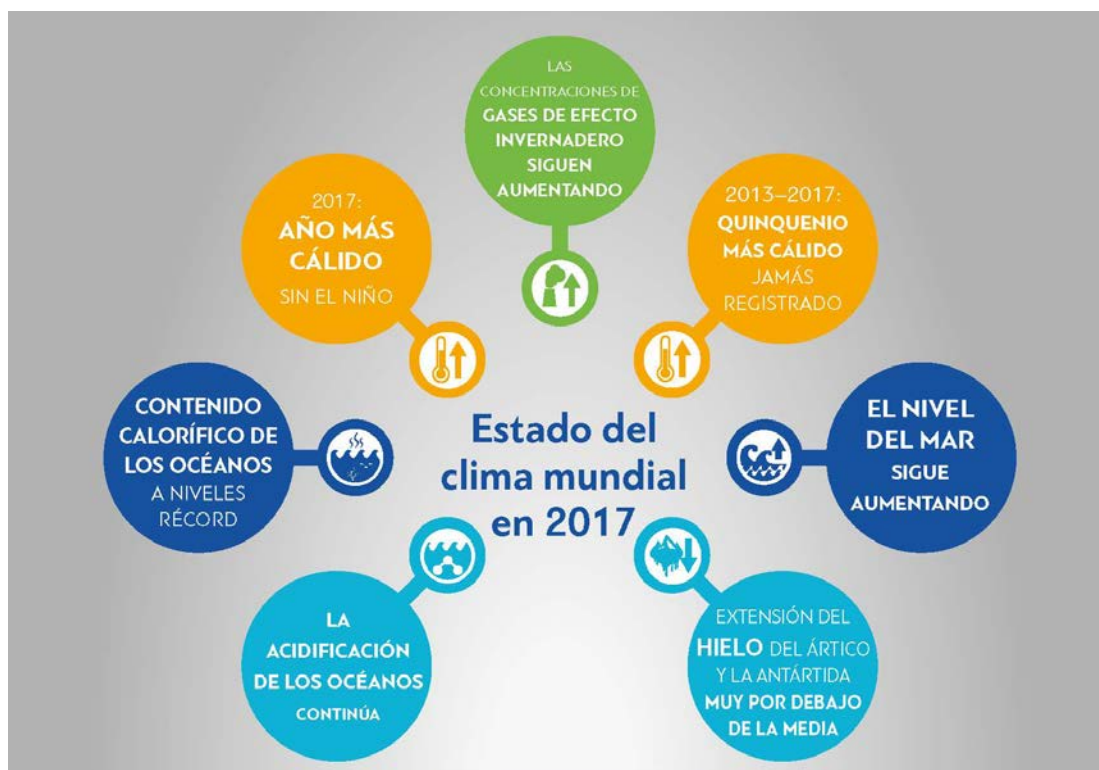
Figura 2 – Principales indicadores del sistema climático utilizados en la Declaración de la OMM (2017)

Las políticas nacionales, al igual que los proyectos e inversiones individuales, cada vez exigen más observaciones climáticas y aportes de la climatología para comprender y abordar los riesgos climáticos. En la actualidad se dispone de una gran cantidad de datos sobre el comportamiento pasado y presente del sistema climático, así como de predicciones y proyecciones sobre su comportamiento futuro a escala mundial, regional y nacional. Los avances en la predicción y la vigilancia del clima logrados en las dos últimas décadas han permitido a la OMM servirse de diversos tipos de datos para caracterizar el sistema climático pasado, presente y el futuro. Esa información ayuda a las sociedades a prepararse mejor para los fenómenos meteorológicos y climáticos extremos y a reducir su vulnerabilidad frente a ellos, e incluye: