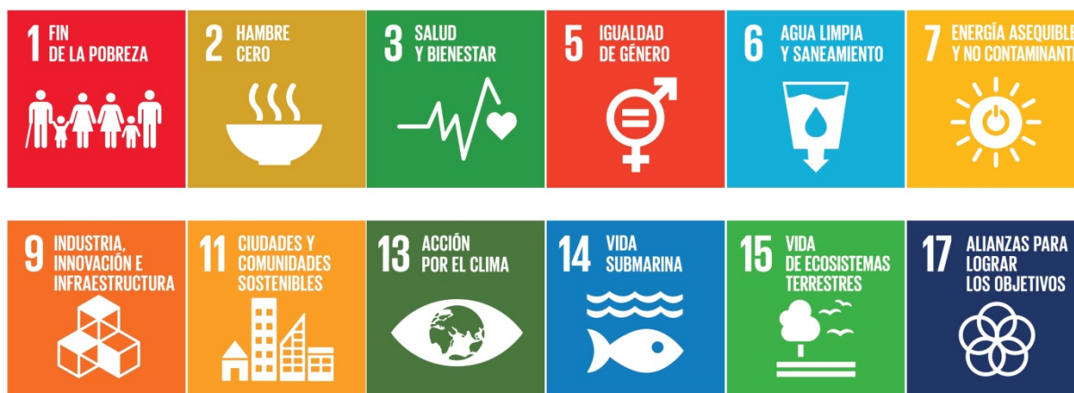
Fig. 1 – Contribución de la OMM a los ODS

En la presente reseña de orientación política se expone el modo en que las acciones llevadas a cabo bajo los auspicios de la OMM a escala nacional y mundial contribuyen a dar respuesta a las preguntas planteadas en el Diálogo Talanoa gracias a la información y los conocimientos sobre el tiempo, el agua, el clima y el medioambiente. También se proponen formas de incluir esa información en los procesos de formulación y aplicación de políticas.