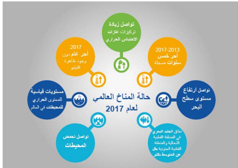
الشكل 2 - المؤشرات الرئيسية لنظام الأرض المستخدمة في بيان المنظمة (WMO) (2017)

وقد تضمن بيان المنظمة (WMO) بشأن حالة المناخ العالمي في 2017، والمعرض على مؤتمر الأطراف الثالث والعشرين (COP-23) في اتفاقية الأمم المتحدة الإطارية بشأن تغير المناخ (UNFCCC) في بون، مؤشرات إضافية تبين بمزيد من العرض السياقي أن مناخ الأرض يتغير. (الشكل 2).