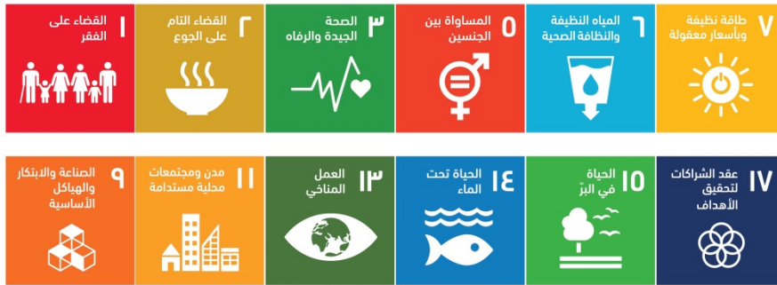
الشكل 1 - إسهام المنظمة (WMO) في تحقيق أهداف التنمية المستدامة (SDGs)

الجوية والمناخية والمائية المتطرفة، والظواهر البيئية المتطرفة الأخرى، بينما تسعى إلى تحقيق أهداف التنمية المستدامة (SDGs)، من خلال توفير البيانات وتقديم الخدمات المستندة إلى أفضل العلوم (الشكل 1).