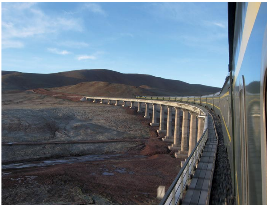
Figure 4 — Certains tronçons des voies de chemin de fer chinoises sont particulièrement exposés aux vents violents, ce qui exige l'attention particulière des prévisionnistes.

de surveillance au sol et des données d'une nouvelle génération de radars d'observation et d'autres stations météorologiques automatisées, et de l'utilisation des produits livrés au moyen de modèles numériques de prévision d'échelle moyenne. Le développement technologique des deux dernières années a montré que les services d'alerte avaient effectivement réduit le nombre des accidents de la circulation et généré d'autres retombées économiques et sociales positives.