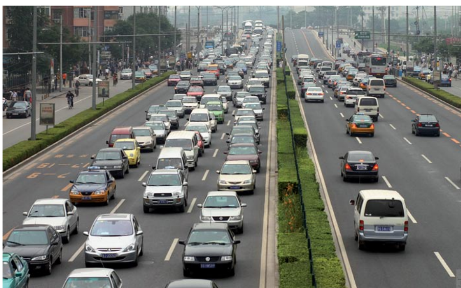
Figure 2 — Optimiser la circulation en anticipant les phénomènes météorologiques à fort impact potentiel: un facteur critique pour les autoroutes très fréquentées de Chine

Toutes les données de gestion et de sécurité routière provenant des stations de surveillance météorologique et les produits de prévision sont intégrés dans une base de données qui dessert le système de gestion, le système de communication d'informations météorologiques, ainsi qu'un certain nombre d'autres systèmes. Le suivi de l'analyse et de l'exploitation des données en temps réel, et l'affichage de ces données sur un même écran ou sur des écrans différents, par chronologie des événements, par station et/ou par conditions atmosphériques, sous forme de tableaux, de diagrammes et de produits